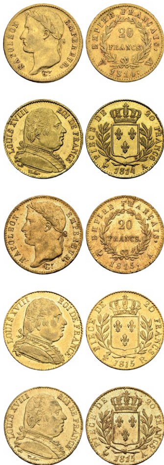
Fünf französische Goldmünzen sind Zeitzeugen der dramatischen Jahre 1814/1815: 20 Frankenstücke von Napoleon 1814, von Ludwig XVIII. 1814, von Napoleons 100-Tage-Regierung 1815, von der Exilzeit Ludwigs XVIII. 1815 mit Prägung in London (Mzz. R) und seiner anschliessenden offiziellen Prägung von 1815

dem bourbonischen Lilienwappen und der Jahreszahl 1814 prägen liess. Napoleon aber, seinem Drang nach Macht weiterhin nachstrebend, landete im März 1815 an der Südküste seines Mutterlandes, worauf die Soldaten gleich scharenweise zu ihm überliefen, und der König ins Exil nach Gent flüchten musste. 100 Tage dauerte dieses letzte Aufbäumen des napoleonischen Reiches, bis der grosse Kaiser die Schlacht bei Waterloo endgültig verlor und nach St. Helena verbannt wurde. Diese drei Monate reichten jedoch aus, dass er erneut Goldmünzen mit der Jahreszahl 1815 schlagen liess. Als Ludwig XVIII. am 8. Juli 1815 abermals als König eingesetzt wurde, war eine der ersten Handlungen – um dem Volk zu zeigen, wer wieder Regent war – neue 20-Frankenstücke ebenfalls mit 1815 in Umlauf zu bringen.