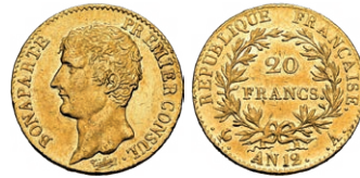
Republik Frankreich 20 Fr. l'an 12 mit Napoleon als «Premier Consul»

Zu jener Zeit gab es in Deutschland eine ganze Reihe verschiedener Münzsysteme, die den länder- und städteübergreifenden Handel nur lähmten. Dem Gesetz von Gresham entsprechend (das minderwertige Geld verdrängt das wertvollere aus dem Verkehr) verhielten sich die meisten Münzherren, indem sie mittels Münzmandaten das Eindringen schlechten Gelds zu verhindern