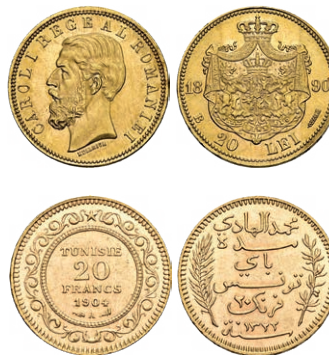
Rumänien 20 Lei 1890 Tunesien 20 Fr. 1904

Die Einführung der Goldmünzen Österreich-Ungarns mit Frankenbezeichnung, führte dazu, dass nun die Prägungen der LMU auch in Südosteuropa in immer grösseren Mengen umliefen. Dieser für die Länder handelsförderliche Umstand war sicher einer der Hauptgründe, weshalb gleich mehrere Herrscher im Balkan in der Folge das Münzsystem der LMU ebenfalls einführten, ohne jemals Vertragspartner zu werden. Schlussendlich haben über 20 Nicht-LMU-Länder in Europa und in Übersee Goldmünzen (und auch Silbermünzen) nach diesen Legierungsvorgaben geprägt.