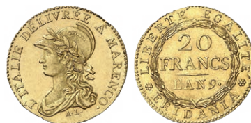
Cisalpinische Republik 20 Fr. l'an 9

Die Schlacht Napoleons gegen die Österreicher vom 14. Juni 1800 hat einer Goldmünze der LMU ihren Namen gegeben. Nach dem Sieg bei Marengo, in der Nähe der oberitalienischen Stadt Alessandria, konnte der junge Feldherr mit dem österreichischen Befehlshaber bereits einen Tag später einen Vertrag abschliessen, in welchem sich dieser verpflichtete, Genua, das Piemont und die Lombardei an Frankreich abzutreten. Die anschliessend gegründete Cisalpinische Republik (16. Juni 1800 bis 11. September 1802) schlug im folgenden Jahr in der Münzstätte Turin 20 Franken Goldstücke, auf deren Vorderseite man L'ITALIE DÉLIVRÉE A MARENGO (Italien wurde befreit in Marengo) lesen kann.