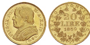
Vatikan, Pius IX., 20 Lire 1869

akzeptiert. Als drei Jahre später, allerdings unter Protest der innerschweizerischen Kantone, diese päpstlichen Goldstücke zurückgezogen und dem Kirchenstaat zugeführt wurden, belief sich die Summe dieses Geldes auf über 1 Million Franken.