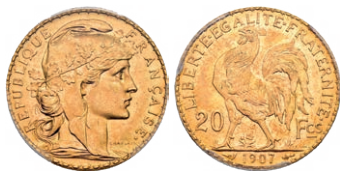
Eine «echte Marianne»: Frankreich 20 Fr. 1907