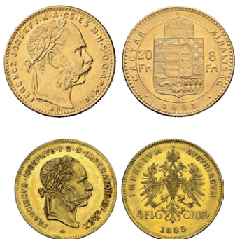
Ungarn 8 Gulden / 20 Fr. 1891 Österreich 4 Gulden / 10 Fr. 1885

Durch das Ausscheiden Österreichs aus dem Wiener Münzvertrag per 31. Dezember 1867 wurde die Monarchie wieder in ihrer Münzpolitik autonom. In der Folge interessierte sich das Land für einen Anschluss an die Lateinische Münzunion, und es kam zu Verhandlungen mit der LMU und einem anschliessenden Vorvertrag. Darin wurde die Grundlage für die Prägung von Goldmünzen geschaffen, welche im Verhältnis 8 Gulden/Forint : 20 Franken (bzw. 4 Gulden/Forint : 10 Franken) standen. Aus diesem Grund wurden von 1870 bis 1892 mehrere Millionen österreichische und ungarische Goldstücke geschlagen, welche auch Frankenbezeichnungen tragen.