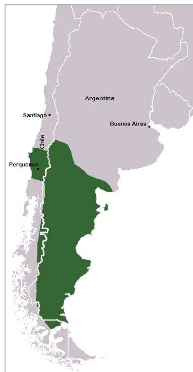
Abb. 1: Karte des geplanten Königreichs Araukanien und Patagonien auf den Territorien Chiles und Argentinens

Wir beschäftigen uns in diesem Aufsatz mit dem Königreich Araukanien und Patagonien im Süden der Länder Chile und Argentinien. Ab der Mitte des 19. Jahrhunderts versuchte der französische Anwalt Orélie-Antoine De Tounens (12.5.1825–19.9.1878) der indigenen Mapuche-Bevölkerung 2 ein eigenes Staatgebiet aufzubauen, was den Chilenen und den Argentinern natürlich äusserst missfiel. Aber alles der Reihe nach!