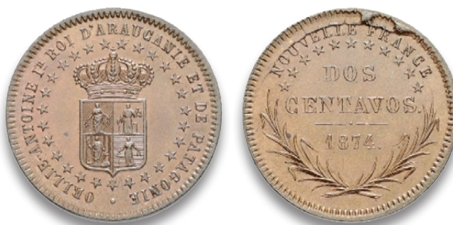
Abb. 3: Dos Centavos 1874 (2. Typ). Die Rückseite mit auffälligem Stempelriss oberhalb NOUVELLE FRANCE 7

Diese Münze zu 2 Centavos wird bei Lecompte in zwei Typen unterschieden, wobei diese recht einfach anhand der Rückseite erkannt werden können. Beim Typ 1 liegen die Sternchen weitgehend unterhalb der Umschrift «NOUVELLE FRANCE», während sie beim Typ 2 ausserhalb dieser Bezeichnung beginnen und enden. Der auffällige Stempelriss von Typ 2 an dieser Stelle sorgte vermutlich bald dafür, dass der Stempel unbrauchbar wurde und infolgedessen ein neuer erstellt werden musste. Lecompte führt jedoch keinen solchen an, weshalb wir ihn an dieser Stelle zeigen und als Typ 3 bezeichnen wollen. Auffällig ist hier der Punkt nach dem Wort «FRANCE». Alle drei Rückseiten scheinen übrigens jeweils mit demselben Vorderseitenstempel kombiniert worden sein.