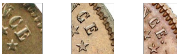
Abb. 4: Lecompte Typ 1, Typ 2 und neuer Typ 3 – von links nach rechts; vergrößerte Ausschnitte

Bei den 1 Pesos-Münzen gibt es bedeutend mehr Varianten, vor allem, wenn die Legierungen und die Randbeschaffenheiten mitberücksichtigt werden. Aber auch hier können 3 Haupttypen unterschieden werden: 1 PESO 1874 mit Mzz. E auf der Wertseite, unterhalb der Palmzweige – 1 PESO 1874 ohne dieses Münzzeichen – UN PESO 1874.